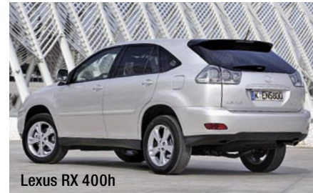
Lexus RX 400h

zyklus bewegt sich mit 10,4 l / 100 km in einem Bereich, der mit dem Spar-Prius nichts mehr zu tun hat, sein gewaltiges Leistungs- und Fahrtdynamikpotenzial liegt dafür auf dem Niveau eines bürigen Achtzylinders. Zahlen gefällig? 200 kW (272 PS) und enorme 750 Nm! Im Prinzip gleicht der Hybridantrieb dem des Prius, doch technisch interessant ist