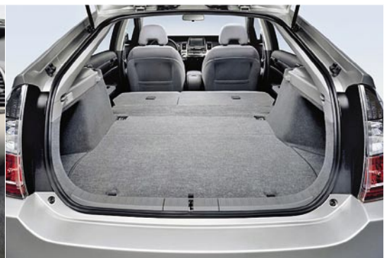
Der flache Kofferraum fasst magere 280 Liter, nach Umklappen der Rücksitzlehne passen 585 Liter rein