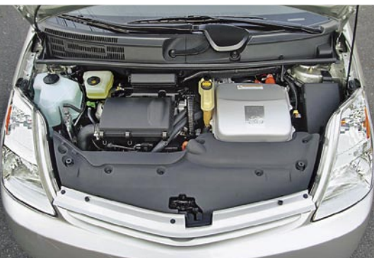
Reichlich Platz für zwei Motoren: links der Benzinmotor, rechts der Elektroantrieb