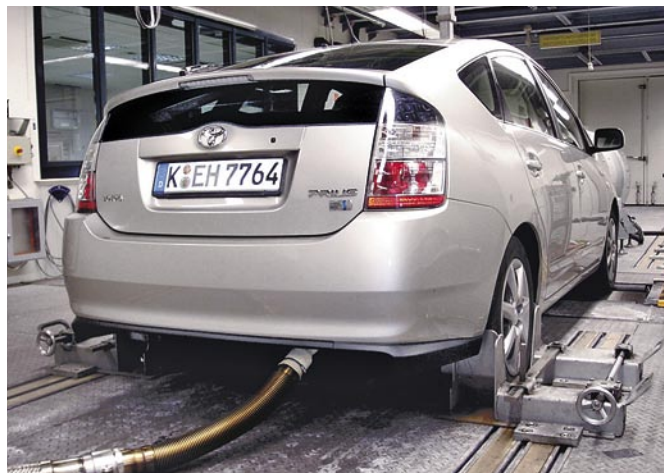
Auf dem Prüfstand im ADAC-Technik-Zentrum in Landsberg: Hier werden nach dem EcoTest-Verfahren der Verbrauch und die Schadstoffe gemessen

Um 90 000 Kilometer in zehn Monaten abzuspulen, musste der hervorragende ausgestattete Prius (in der Executive-Version für 25 400 €) häufig bewegt werden – was viele Kollegen für Dienstreisen fleißig