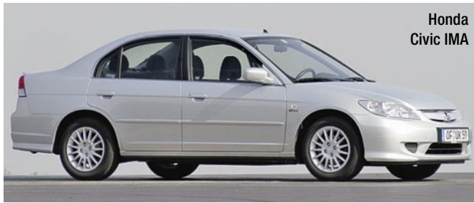
Honda Civic IMA

HONDA CIVIC IMA. Im Gegensatz zum Voll-Hybridsystem des Toyota Prius, bei dem Elektro- und Benzinmotor auch autark fahren können, ist beim Mild-Hybridsystem des Civic IMA der relativ kleine Elektroantrieb (6,5 kW) lediglich zur Unterstützung des Benzinmotors (1,4-Liter, 61 kW/83 PS) da. Gleichzeitig fungiert er als »Start-Stopp-Generator«, der den Benziner bei stehendem Auto automatisch abstellt und ihn beim Einlegen des Gangs