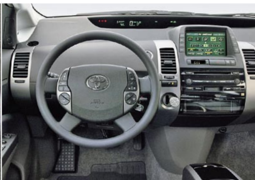
Gewöhnungsbedürftig: Digitaltacho und mittig das Zentraldisplay mit Touchscreen-Monitor